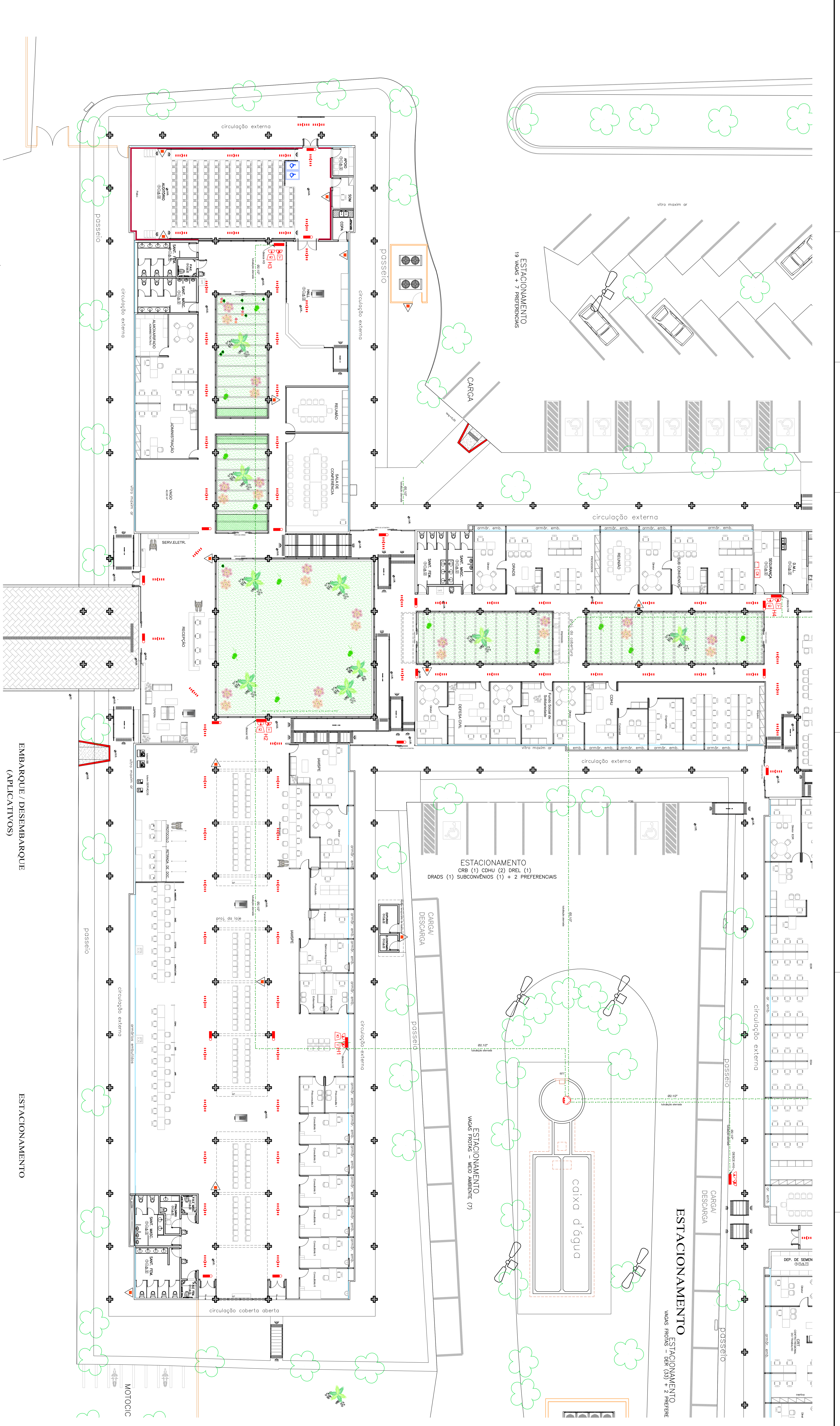
HIDRANTE / EXTINTOR / R. DE FUGA SETOR 1 ESC. 1129 ESCALA GRÁFICA