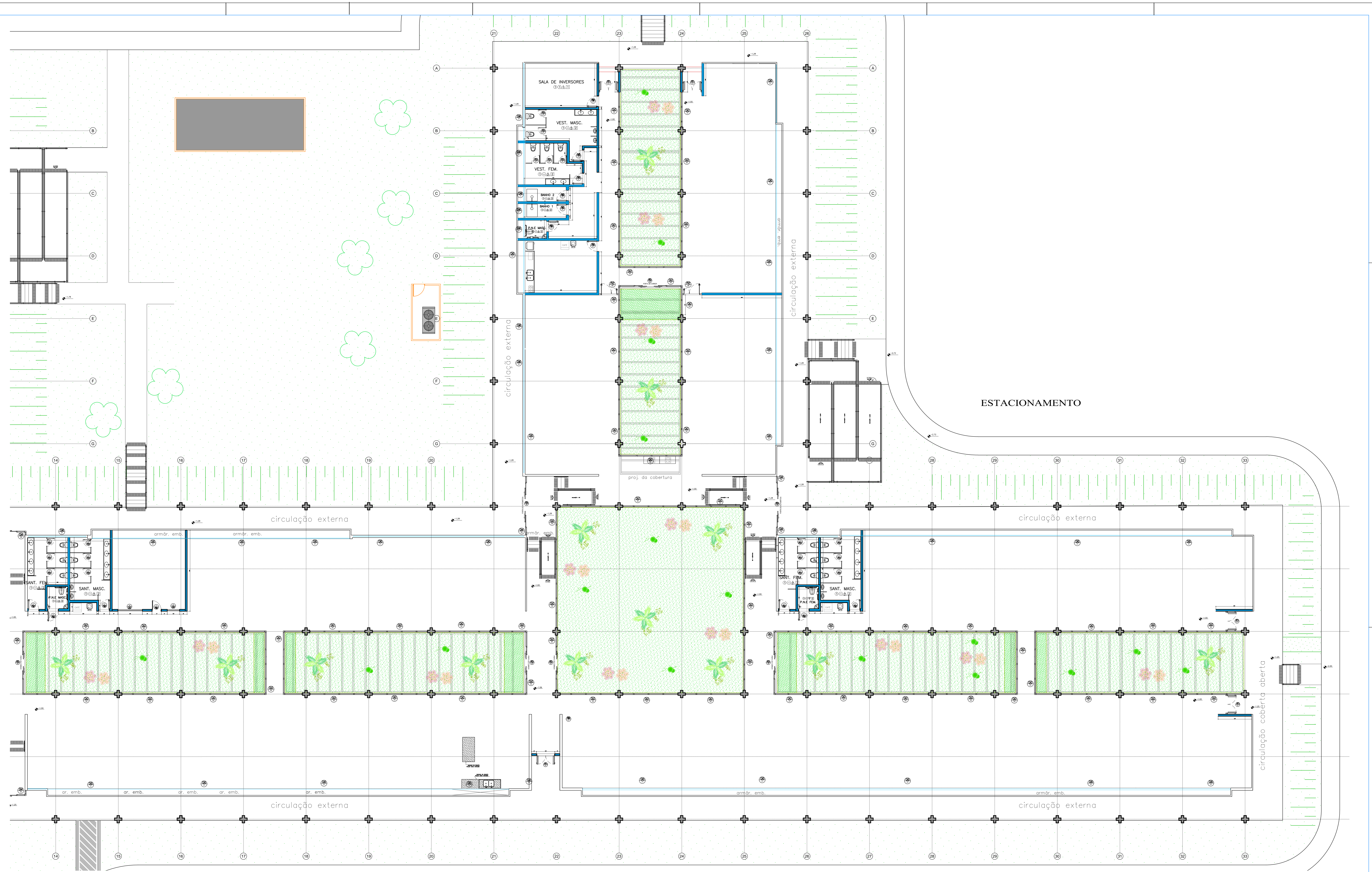
PLANTA BAIXA SETOR 3 ESC. 1:100 ESCALA GRÁFICA