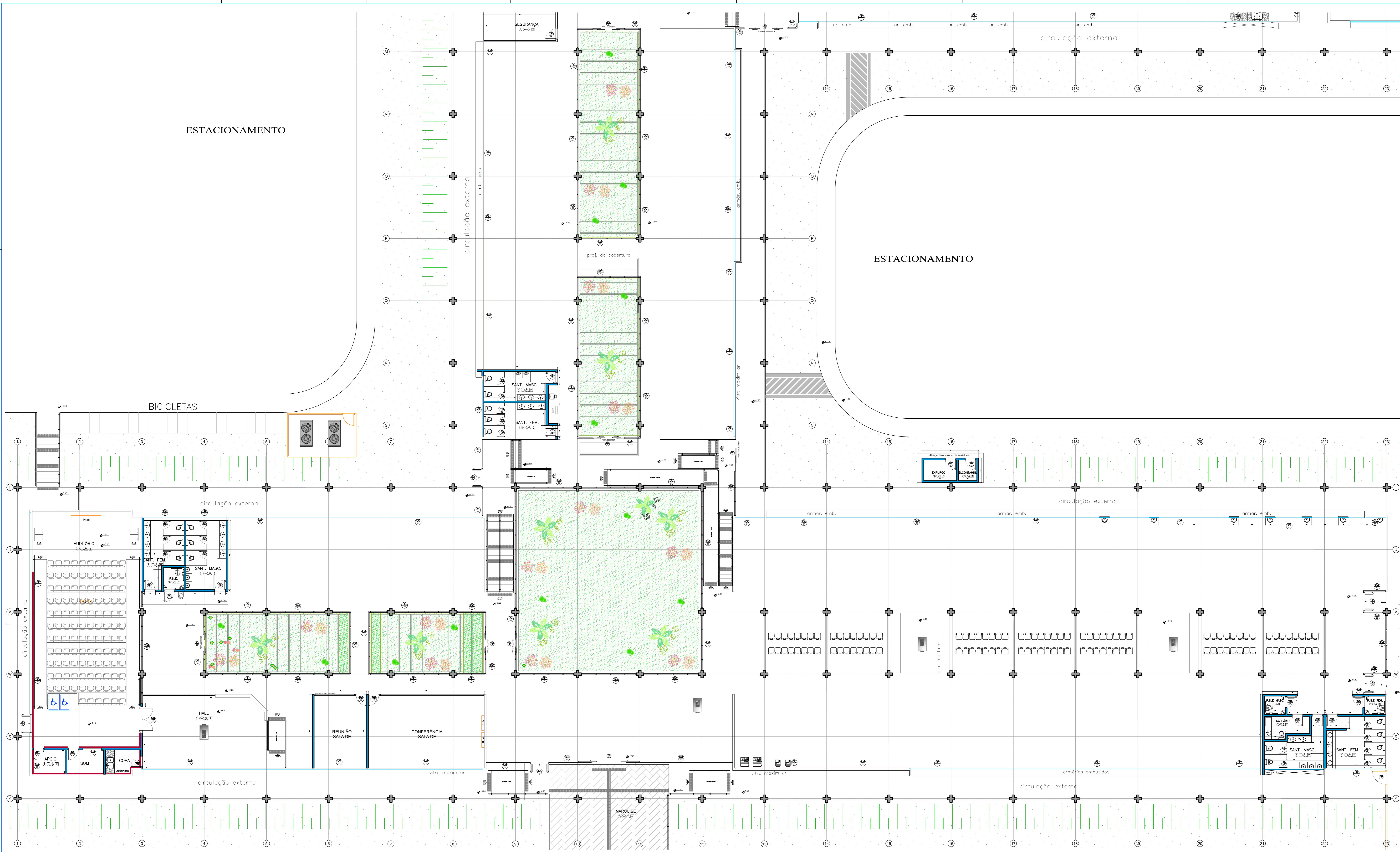
PLANTA BAIXA SETOR 1 ESC. 1:100 ESCALA GRÁFICA