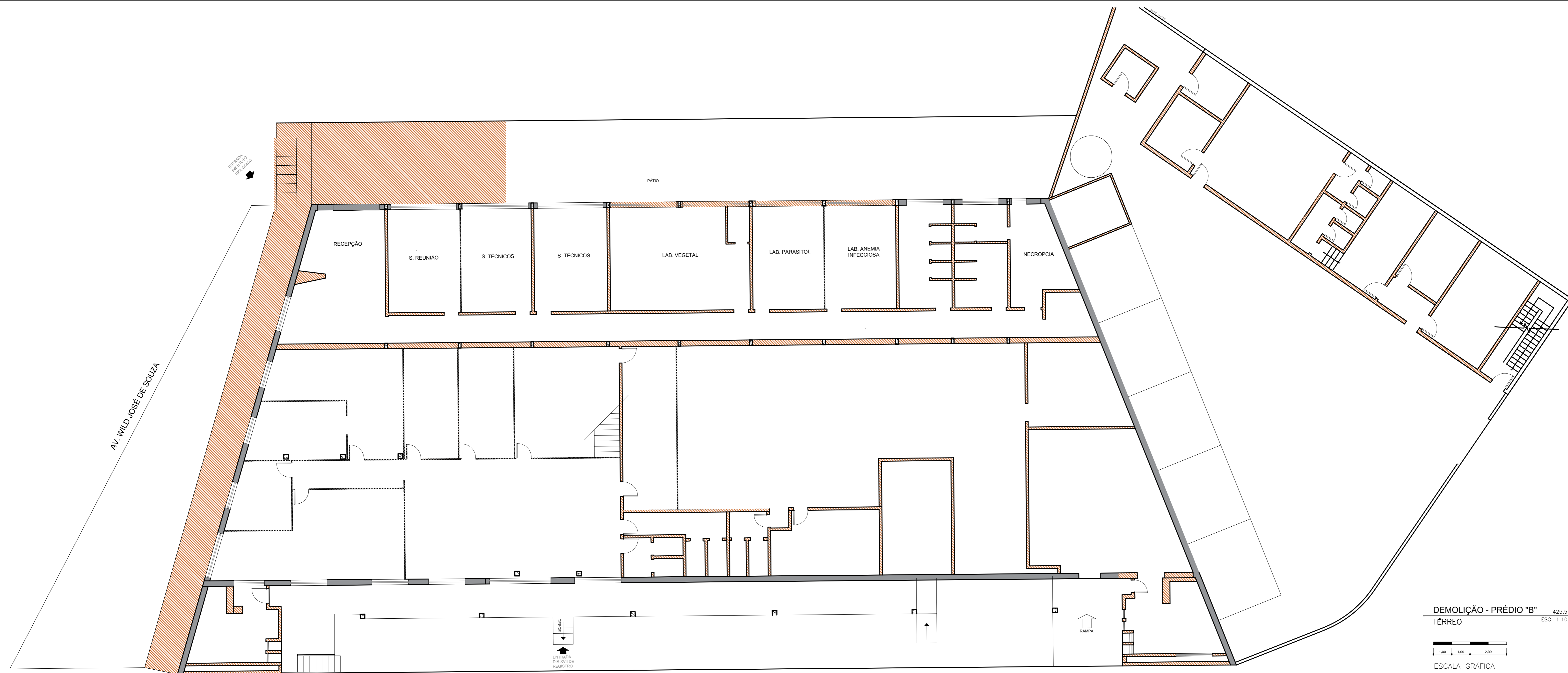
DEMOLIÇÃO - PRÉDIO "B" TÉRRECO 425,53 ESC. 1:100 ESCALA GRÁFICA