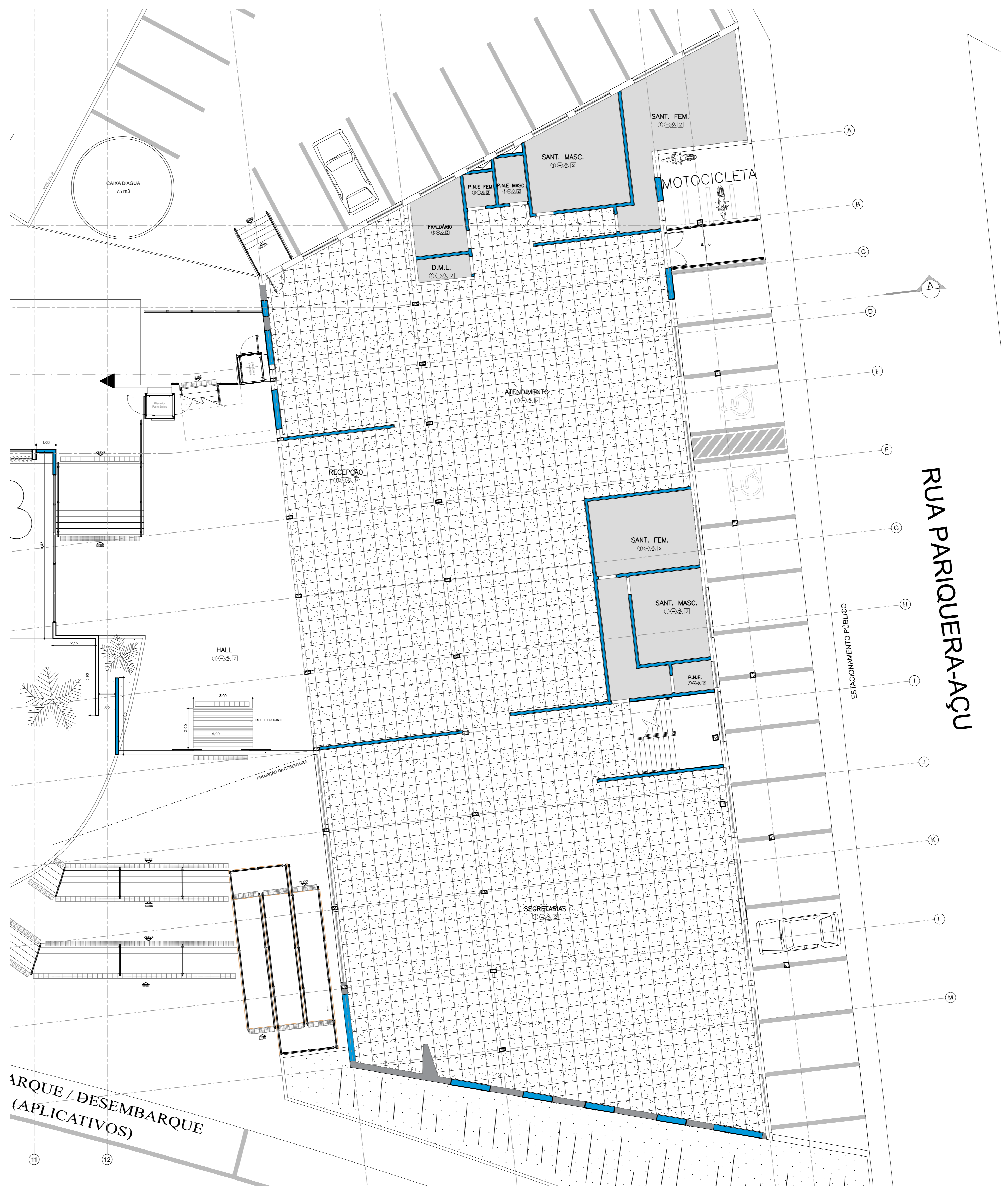
PLANTA DE FORRO TERREO ESC. 1/100 ESCALA GRÁFICA